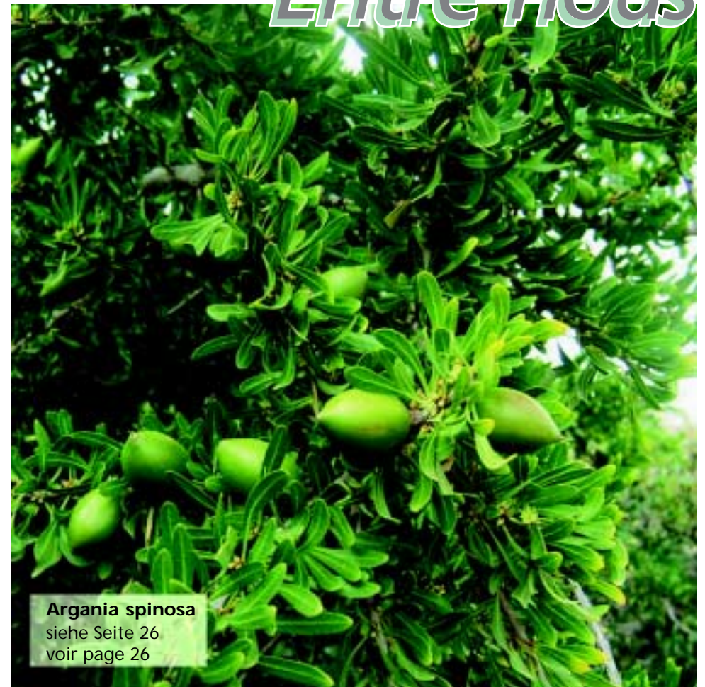
Argania spinosa siehe Seite 26 voir page 26